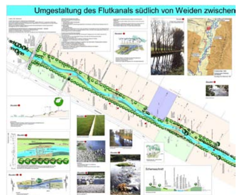
Umgestaltung Flutkanal Weiden, 2005