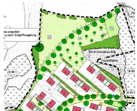
Grünordnungsplan „Am Schönberg“ Wenzelbach 2004