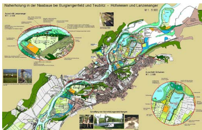
Naherholungskonzept Naabaue Burglengenfeld, 2003