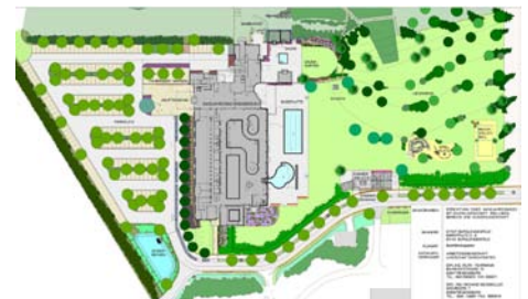
Freianlagen Ganzjahresbad Burglengelfeld, 2005/06