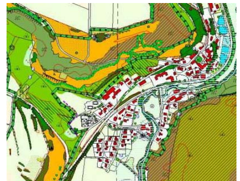
Landschaftsplan Stadt Berching, 2003