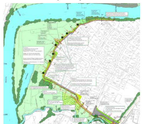
Hochwasserschutz Zeitlarn, LKR Regensburg, 2006