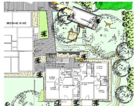
Freiflächengestaltungsplan Berliner Straße, 2003