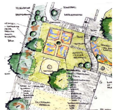
Bauberatung, DE Schnufenhofen, 2003