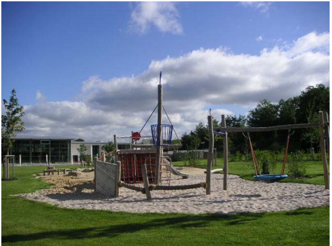
Freianlagen Ganzjahresbad Burglengenfeld, Spielschiff 2005/06